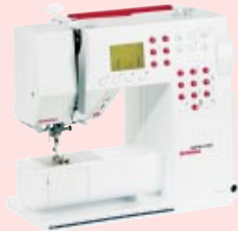
activa 240 BERNINA®

Die activa 220 ist herrlich unkompliziert und bietet alle Basisfunktionen, die man zum Nähen braucht.