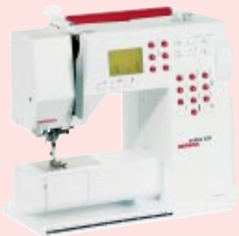
activa 220 BERNINA®