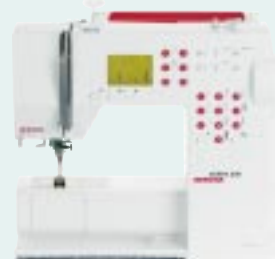
activa 230 BERNINA®