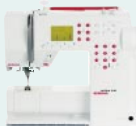
activa 240 BERNINA®

Die technische Ausstattung der activa kann sich sehen lassen. Für welche der drei „activen Varianten“ Sie sich entscheiden, liegt bei Ihnen – und hängt davon ab, wie viel Komfort Sie wünschen. Auf die Präzision und die Leistung des kraftvollen DC-Antriebsmotors Ihrer BERNINA können Sie sich in jedem Fall verlassen.