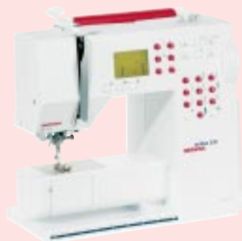
activa 230 BERNINA®