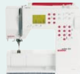
activa 220 BERNINA®